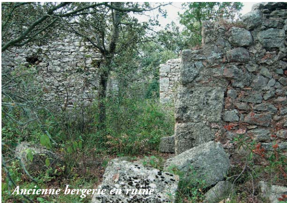
Ancienne bergerie en ruine

Dans les garrigues, on dénombrait 6 grandes bergeries, aux Roques, à Belbezé, aux Onglous et à l'hera; 7 autres à la Matte et