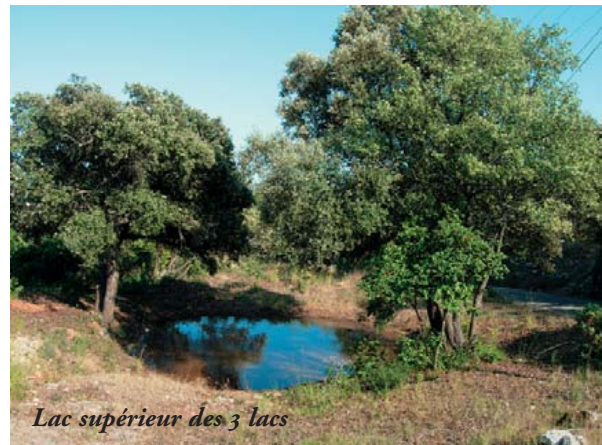
Lac supérieur des 3 lacs

au Mas blanc; 1 bergerie à la Garenne et 1 à St Vincent. Il reste aujourd'hui 2 ou 3 bergeries rénovées en habitation et quelques ruines pour les autres.