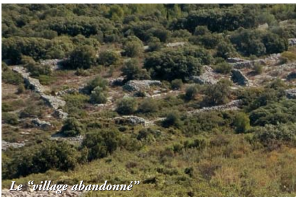
Le "village abandonné"

Aux Cataux de nombreux murs de clôtures et les ruines de 3 ou 4 maisons sont une énigme. Les anciens appellent ce lieu le village abandonné. On ne retrouve pas d'écrits le mentionnant. S'agit il de plusieurs bergeries entourées de parcs ou étaient parqué les gros troupeaux ? De fait, à Poussan les propriétaires de bêtes à laine