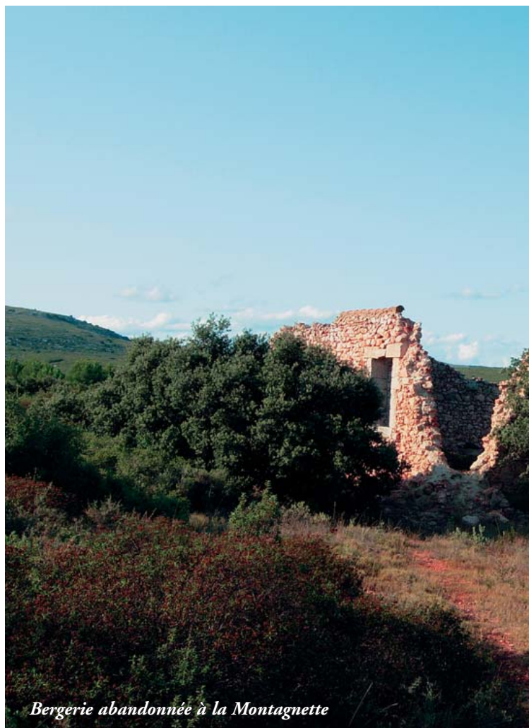
Bergerie abandonnée à la Montagnette