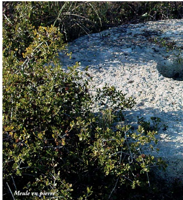
Meule en pierre