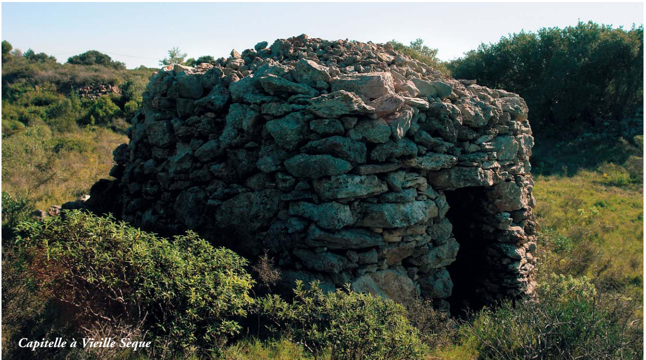
Capitelle à Vieille Sègue

abris rustiques sont appelées chez nous capitelles (petit abri pour la tête). On en dénombre au moins sept. Pendant des années les défrichements ont grignoté la garrigue. La crise du phylloxera en 1871, l'apparition du tracteur dans les années 1950 qui limite l'accès à de nombreuses parcelles, le gel de 1956, provoquent le recul de la culture de la vigne et de l'olivier. Peu à peu ces nouvelles terres défrichées sur les garrigues ont été abandonnées et la plupart de abris, des murs construits ne sont plus entretenus... Ils témoignent encore du courage et de la peine déployée par nos aïeux. De nos jours certains coteaux ont été repris par les taillis. Ces vestiges, ces petits bâtis font aussi partie de notre patrimoine.