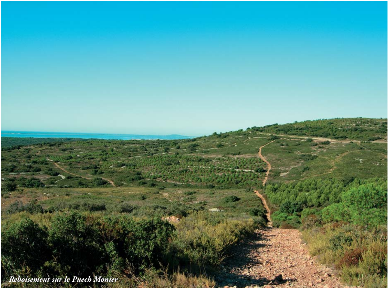
Reboisement sur le Puech Monier

La municipalité qui possédait les garrigues de la réserve, a racheté celles de Puech Monier, et depuis 1982 les louent pour l'exploitation d'une carrière à ciel ouvert de granulats calcaires.