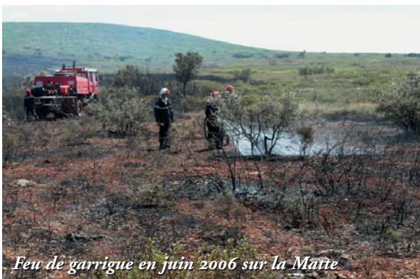
Feu de garrigue en juin 2006 sur la Matte

Comme nous l'avons vu, au cours des XVIII ème et XIX ème siècles, les paysans et les éleveurs se sont mis à agencer les coteaux composant nos garrigues. Des murs de pierres sans mortier, se succédant en terrasses pour retenir la bonne terre, vont être construits avec les pierres sèches provenant de l'épierrement. Les pierres excédentaires vont être entassées et former des clapas (monticule). Certains tas formant des tours, pourraient avoir servi de poste d'observation aux bergers pour surveiller les troupeaux. L'édification d'abris de pierre sèche avec une voûte à encorbellement est aussi un moyen de stockage de ces cailloux. Ces