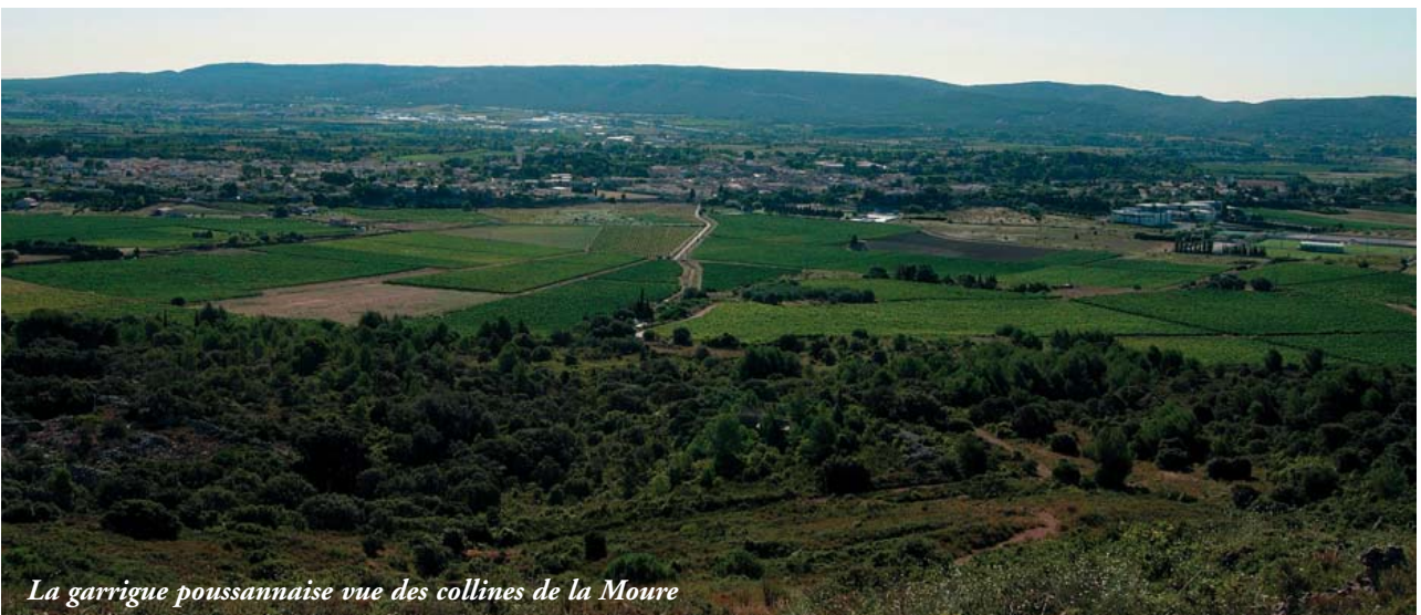
La garrigue poussannaise vue des collines de la Moure

Les taillis de chênes verts ne sont pas une garrigue. Aujourd'hui, leur forte progression accroît les risques d'incendie et font disparaître ces milieux ouverts où vivent la flore et la faune.