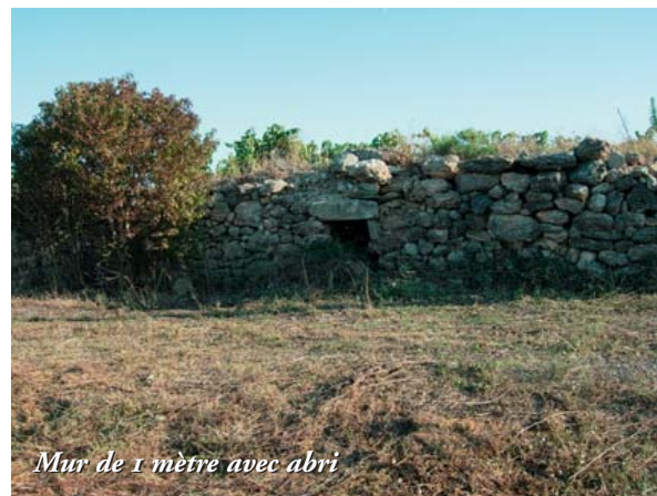
Mur de 1 mètre avec abri