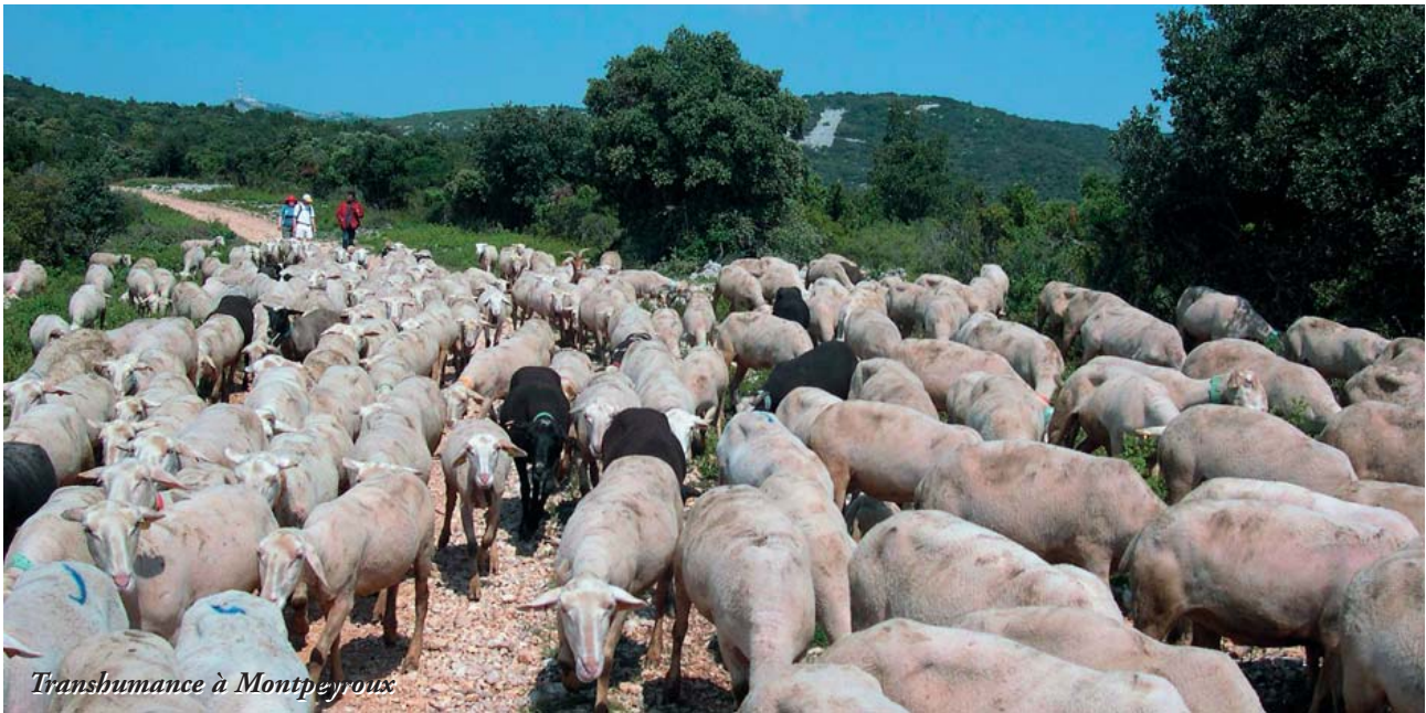
Transhumance à Montpeyroux

nourrir que 3000, il faut convertir des champs en pâtures.