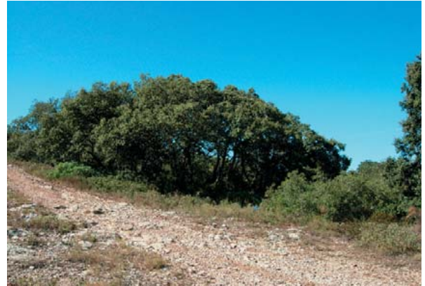
Taillis de chênes verts ou Yeuses

Il n'existe plus de forêts de grands chênes verts ou yeuses. L'incendie, l'abattage ont ouvert des clairières ou se sont établis les garrigues dans ce milieu ouvert favorable à la biodiversité.