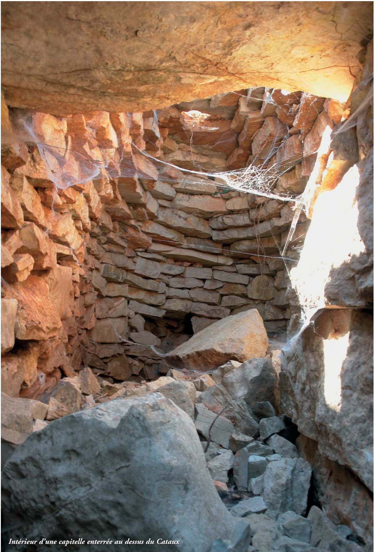
Intérieur d'une capitelle enterrée au dessus du Cataux