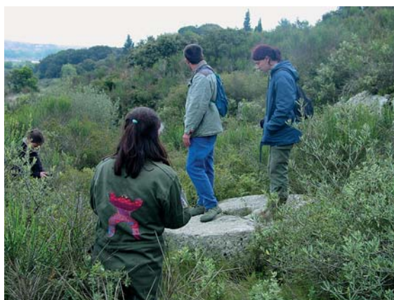
Visite du site de Valaury

Son rapport fait état de « quatre meules taillées encore en place, de 1,80 mètres de diamètre pour 50 centimètres d'épaisseur, en calcaire coquillier. Elles étaient destinées certainement aux pressoirs à olives, car le blé est une céréale trop abrasive pour ce type de roche. La datation est incertaine mais évaluée au XIX ème siècle. »