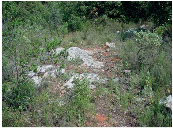
Le banc calcaire affleurant