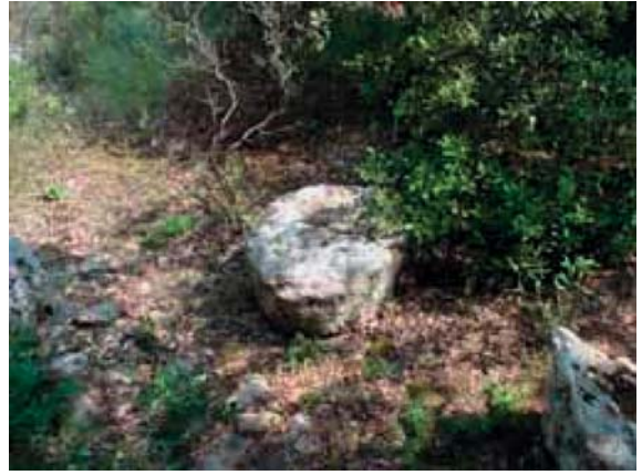
Fragment de meules

Taillées dans la roche à même le sol (banc calcaire gréseux), leurs dimensions atteignent 1,50 mètres de diamètre pour 0,50 d'épaisseur.