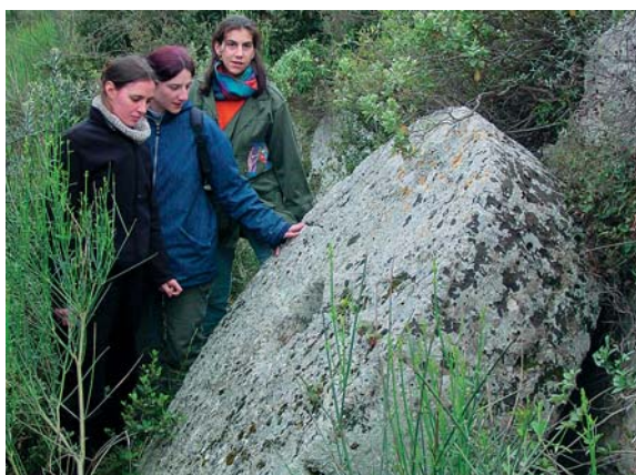
Un ouvrage sculpté remarquable