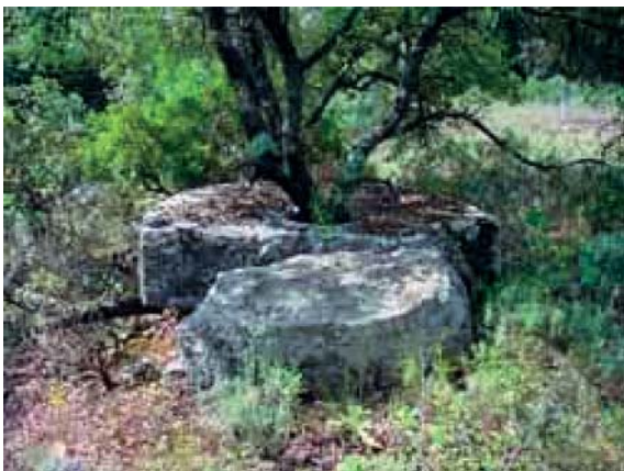
La meule citée dans le livre de M. Lugand

Cette zone d'extraction, de plus d'un demi-hectare, cache non seulement quelques meules ou fragments de meules mais aussi les cavités d'où ces meules ont été extraites.