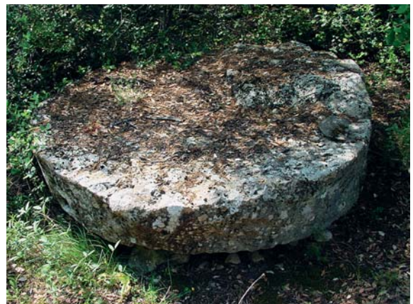
Une meule en fabrication presque terminée