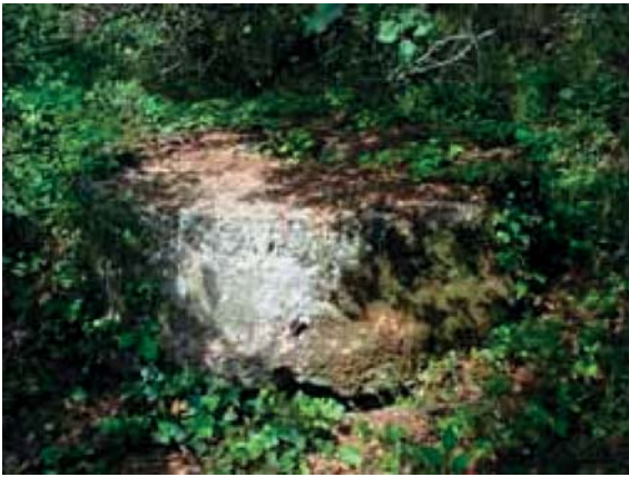
Les dimensions imposantes des meules

Taillées dans la roche à même le sol (banc calcaire gréseux), leurs dimensions atteignent 1,50 mètres de diamètre pour 0,50 d'épaisseur.