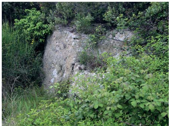
Une étagère de roche

Cette carrière est située à flanc de colline, sur le versant ouest du ruisseau Valaury. La roche est visible aussi bien horizontalement sur le sol que verticalement le long d'une étagère de 2 à 3 mètres de haut.