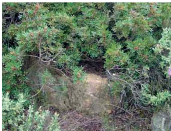
Sous la végétation, la meule