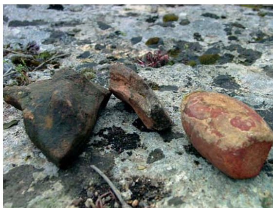
Tessons d'amphore sur une meule