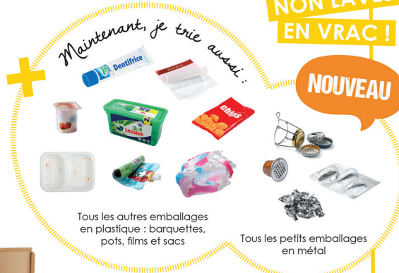
Tous les autres emballages en plastique : barquettes, pots, films et sacs

Dans les bacs de tri, tous les emballages doivent être jetés