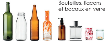
Bouteilles, flacons et bocaux en verre

Collecté en point d'apport volontaire, le verre se recycle à l'infini !